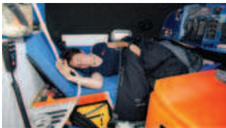
La gestion du sommeil : l'une des clefs de la réussite de ce record...

tour du monde sans escale aurait été, en soi, un exploit, mais s'emparer du record en plus, cela mérite évidemment mes plus chaleureuses félicitations ! Pour avoir vécu, et c'est encore très frais dans ma mémoire, le grand sud en multicoque, je sais à quel point cela peut être difficile nerveusement. Je suis certain que cela a parfois dû être très éprouvant, et j'ai souvent pensé à elle lorsqu'elle se trouvait dans les mauvais coins, avec le vent qui vient du Sud-Ouest et des grains qui s'abattent violemment sur le bateau. Son trimaran est grand, il y a de la surface de toile et dans ces moments-là ce n'était pas l'équipe à terre qui allait faire grand-chose pour elle ". Avant de poursuivre : " j'espérais garder le record un peu plus longtemps, mais je ne l'ai jamais mis sur un piédestal non plus. Cependant je ne m'imaginai pas que Ellen le battait aussi vite, et avec autant d'efficacité ". Alors, à qui le tour ?