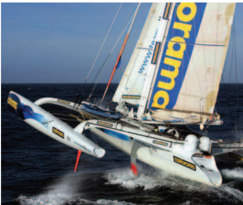
Ce trimaran est une vraie bête de course, mené de mains de maître par un très grand marin...

Ellen Mac Arthur vient d'écrire l'une des plus belles pages de la course au large. Francis Joyon avait réalisé un exploit, elle vient d'accéder au Panthéon des navigateurs. Elle a placé un peu plus haut encore la barre, et comme on l'avait déjà écrit l'an dernier, alors qu'on croyait ce record établi pour longtemps, " ce temps là, il faudra aller le chercher ". Un Francis Joyon qui lui rendait hommage dès son arrivée : " le simple fait d'avoir réussi à boucler son